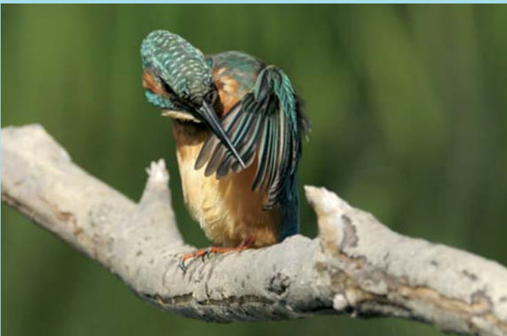
Eisvogel – Vogel des Jahres 2009