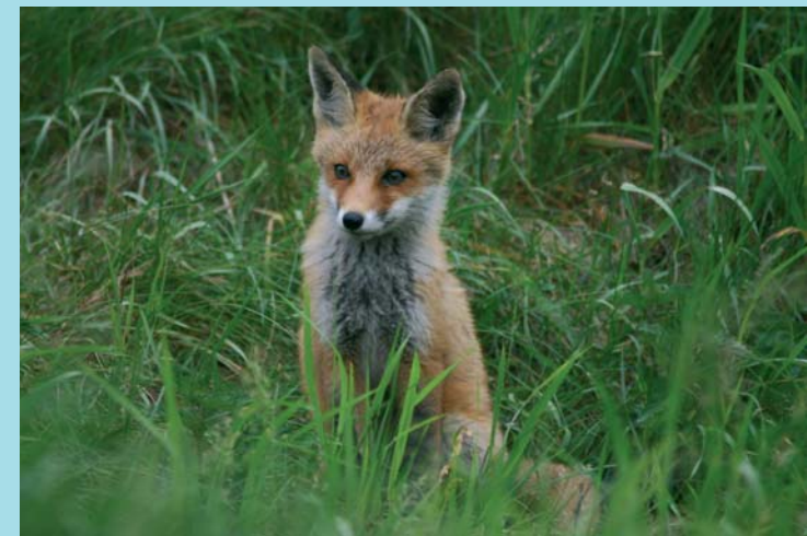
Jungfuchs